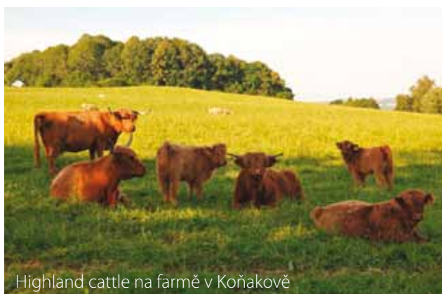
Highland cattle na farmě v Koňakově

Pro rodinu Kotajných, kteří zde hospodaří, je neustálé zdokonalování péče o zvířata snad nejdůležitějším principem podnikání. Nechybí jim však ani snaha připomínat slavnou rolnickou minulost předků.