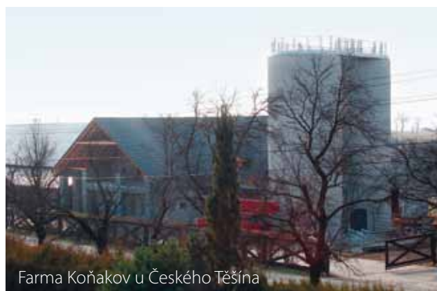
Farma Koňakov u Českého Těšína

Jako novinku plánuje, že od letošního roku začne i s řeznickými službami. Pokud si zákazník bude přát, maso z farmy mu odborně naporcují a domů si jej odnese v úhledných vakuovaných balíčcích.